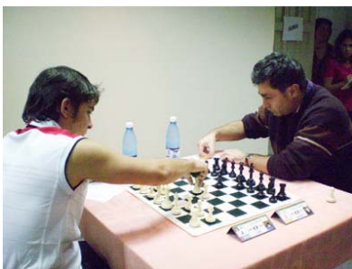
Bruzón - Ivanchuk

En cuestiones de talento, la evaluación es muy difícil, ya que pocos talentos naturales han surgido en la historia como el de Spassky. Pero el carácter suele ser un factor tan fundamental como para compensar todo. Spassky vivió también un período "especial" donde todo recurso era escaso en su país, lo que seguramente contribuyó a formar un carácter.